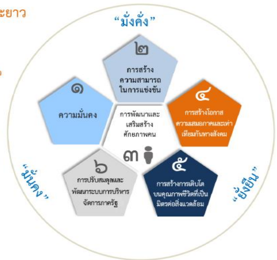
ความเชื่อมโยงของยุทธศาสตร์ชาติกับแผนในระดับต่างๆ

เพื่อให้บรรลุวิสัยทัศน์ “ประเทศไทยมีความมั่นคง มั่งคั่ง ยั่งยืน เป็นประเทศพัฒนาแล้ว ด้วยการพัฒนาตามปรัชญาของเศรษฐกิจพอเพียง” นำไปสู่การพัฒนาให้คนไทยมีความสุข และตอบสนองต่อการบรรลุซึ่งผลประโยชน์แห่งชาติ ในการที่จะพัฒนาคุณภาพชีวิต สร้างรายได้ระดับสูงเป็นประเทศพัฒนาแล้ว และสร้างความสุขของคนไทย สังคมมีความมั่นคง เสมอภาคและเป็นธรรม ประเทศสามารถแข่งขันได้ในระบบเศรษฐกิจ