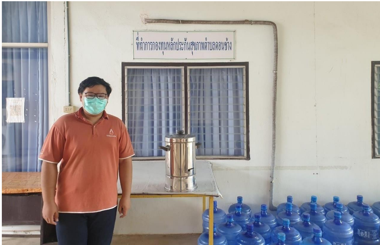
ภาพที่ 5.2 กิจกรรม/โครงการขององค์การบริหารส่วนตำบลดอนช้าง อำเภอเมือง (2)