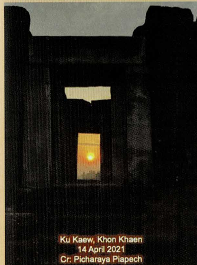
Ku Kaew, Khon Khaen 14 April 2021

3. บรรณาลัย เป็นรูปสี่เหลี่ยมผืนผ้า อยู่ด้านซ้ายของปราสาทประธานก่อด้วยศิลาแลง ขนาดอาคารยาว 7.50 เมตร หันหน้าไปทางทิศตะวันตก อาจจะใช้เก็บเครื่องใช้ในพิธีกรรม หรืออาจจะเก็บคัมภีร์สำคัญทางศาสนา